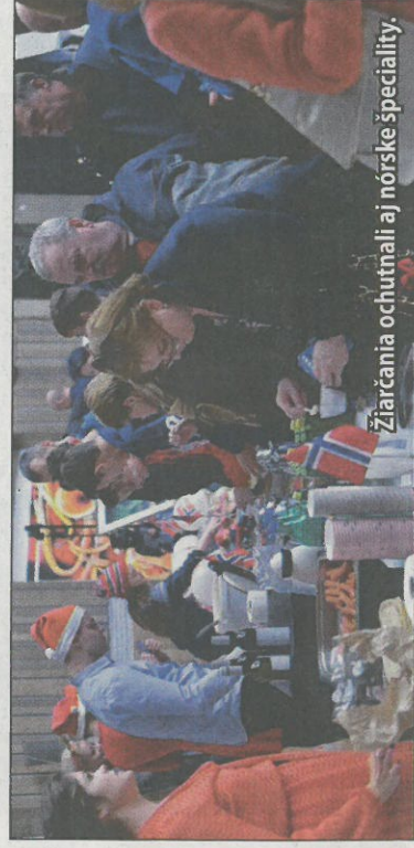
Žiarčania ochutnali aj nórske špeciality.

Zimnú údržbu ciest, chodníkov, ale aj parkovísk v našom meste zabezpečuje spoločnosť Technické služby. Pre efektívnejšiu údržbu kúpili, ešte pred tohtoročnou zimnou sezónou, niekoľko nových strojov. Technické služby rozšírili svoj vozový park o nový sypač s radlicou Mercedes Unimog s novou, 3,2 metrovou radlicou. Ten bude slúžiť na zimnú údržbu ciest v meste a nahradí staré Iveco. Ďalej kúpili zánovnú multiradlicu so sypačom a taktiež novou radlicou. Aj tento stroj bude udržiavať chodníky v našom meste. Do tretice kúpili novú natáčaciu zadnú radlicu za traktor, ktorý bude pomáhať odhŕňať sneh na parkoviskách a ďalších komunikáciách. „V neposlednom rade bude zimnú údržbu vykonávať aj nové rýpadlo - nakladač Caterpillar. Ten