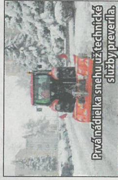
Prvá májka snehu už technické služby preverila.